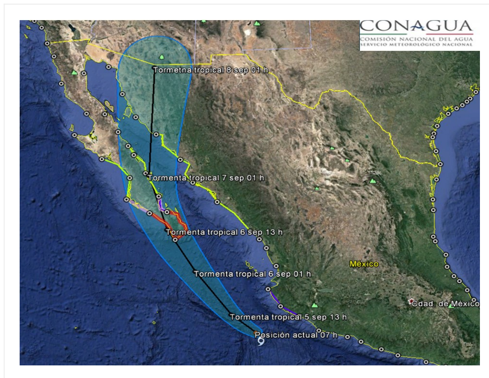
Traectoria pronóstico de la Tormenta Tropical "Newton"